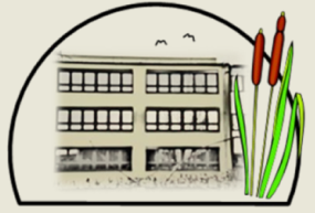
Gesamtschule Am Schilfhof