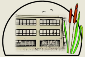
Gesamtschule Am Schilfhof